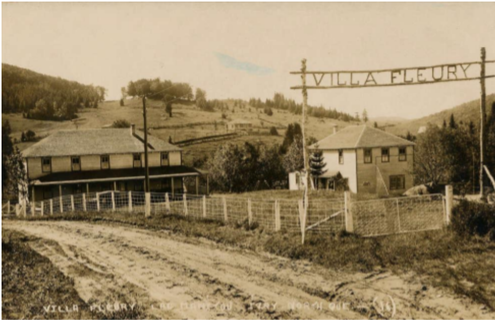
La Villa Fleury, vers 1925 carte postale par Ludger Charpentier, no 16 (Patrimoine-Laurentides)

La Villa Fleury était opérée par la famille Fleury depuis au moins 1925 lorsqu'une petite annonce dans La Presse disait « LAC MANITOU Villa Fleury, Ivry, Que, endroit idéal pour vacances. Eau courante, électricité, tennis, danse, etc. Prix modéré.»