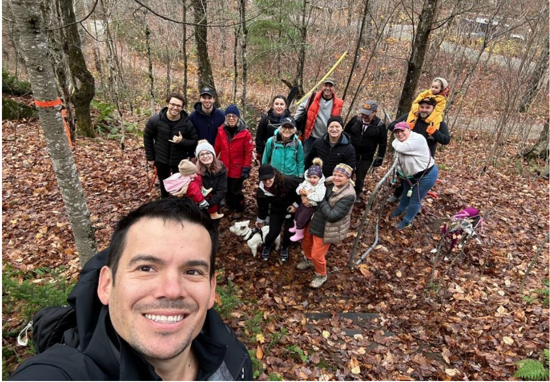
Dégagement des sentiers