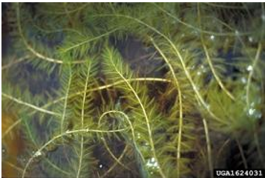
Le myriophylle à épis

Monica Heller ( monica.heller@utoronto.ca )