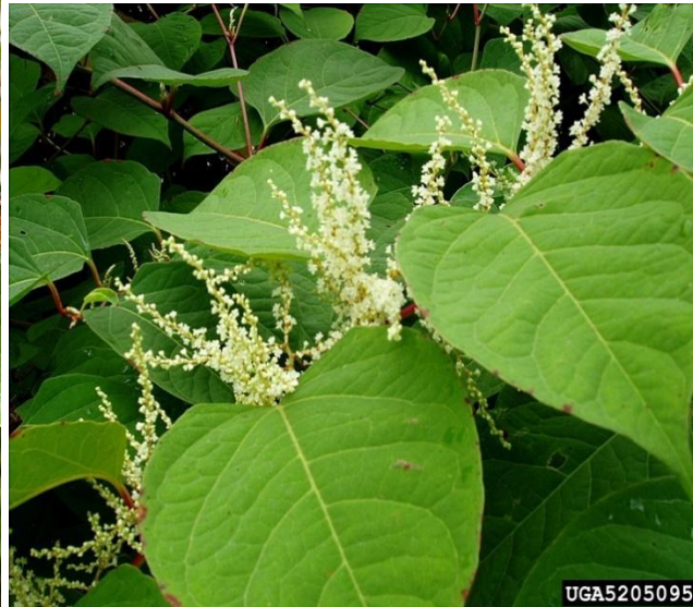
La renouée du Japon