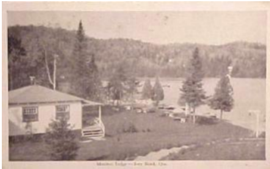
Manitou Lodge

Ils ont également construit des terrains de basket-ball, de tennis et de volley-ball, ainsi qu'un terrain de fer à cheval.